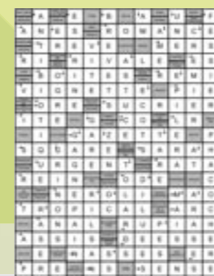
solution de la grille n° 9